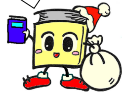
毛呂山町立図書館キャラクター ブックサタ